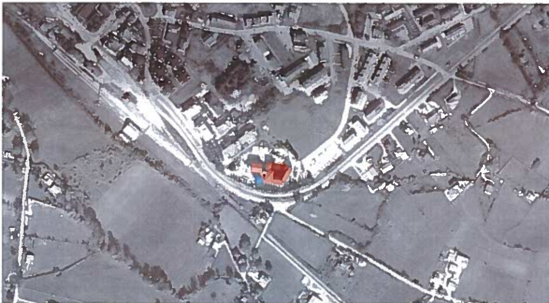
Figura 1. Vista satellitare del Presidio Ospedaliero

garantiti dal contiguo corpo A, con il quale non ci riscontrano sfalsamenti di livello, così come con il corpo D.